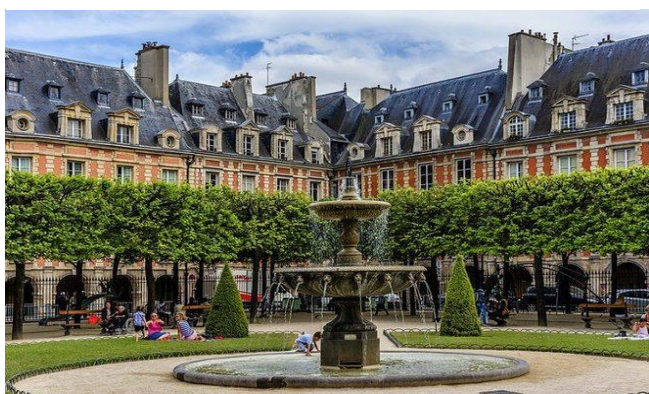
L'hôtel de Sully