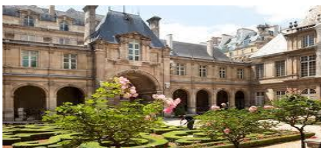
L'hôtel de Sully